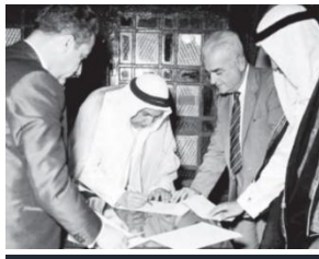
التصديق على الدستور