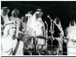
إعلان استقلال دولة الكويت

س: ضع العبارة المناسبة أمام الصور التالية: