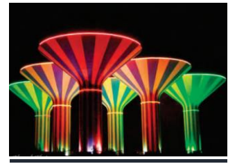
تزيين البلاد بأعلام الاحتفالات الوطنية