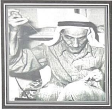
٣ - خياطة البشوت ص ٢٩