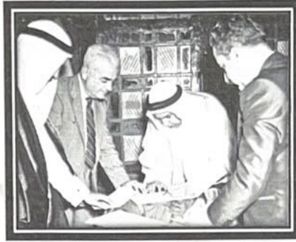
٢ - الاستقلال / الشيخ عبدالله السالم ص ٦٣