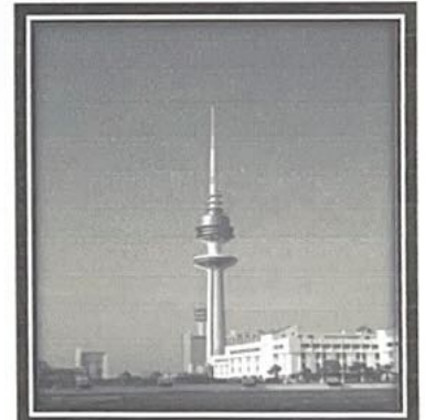
٤ - معالم دولة الكويت / برج التحرير ص ٦٨