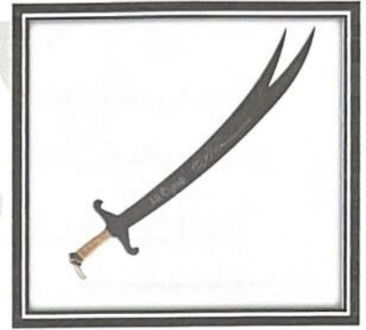
١ - مظاهر الحضارة الاسلامية / الصناعة ص ٥٥