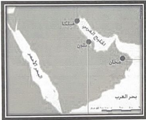
٦ - حضارات منطقة الخليج العربية قديما ص ٤٩