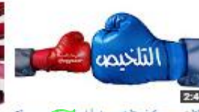
التلخيص - كيف تلخص نصاً بطريقة صحيحة؟ 276 views - 2 months ago