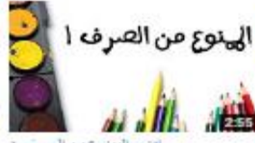
الاسم المنوع من الصرف 1 570 views - 3 months ago