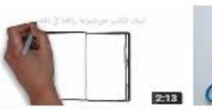
موضوع تيسر - كيف تكتب موضوعاً غاراً التخليص؟ 117 views - 4 days ago