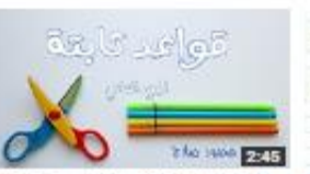
قواعد ثابتة تساعد في الإعراب الجزء الثاني 195 views - 1 week ago