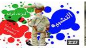
التشبيه: أجزاءه، أنواعه، أمثاله 398 views - 1 month ago