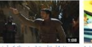
بناء فعل الإنشاء (مع نون التوكيد أو نون النسوة) 177 views - 3 months ago