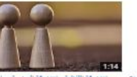
الإضافة الظنية - الإضافة المعنوية - ما تكيد الإضافة 457 views - 2 months ago