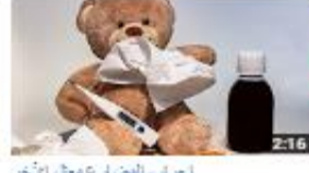
إعراب المضارع معل الآخر 551 views - 3 months ago