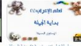
سلسلة تعلم الإعراب (1) بداية الجملة - المستوى البسيط 511 views - 3 months ago