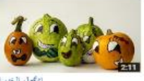
الإعجاز الضميمة 1,024 views - 3 months ago