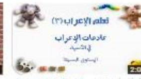
تعلم الإعراب (3) عناصر الإعراب في المستوى البسيط 132 views - 1 month ago