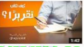
تقريراً؟ 192 views - 2 months ago