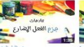
جزم الفعل المضارع 296 views - 3 months ago