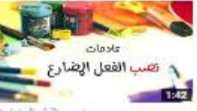
نصب الفعل المضارع 153 views - 3 months ago