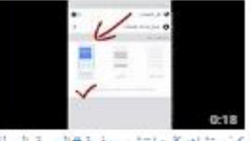
كيف تتأكد من ما تشتره صفحة # العربية السهلة على فيس بوك؟ 51 views - 2 months ago