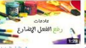
رفع الفعل المضارع 179 views - 3 months ago