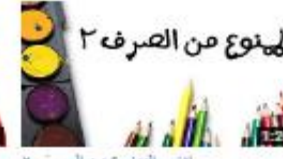
الاسم المنوع من الصرف 2 181 views - 3 months ago