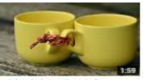
التركيبات الكشمية: التركيب النقص 381 views - 1 month ago