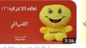
سلسلة تعلم الإعراب (2) الضمائر 347 views - 2 months ago