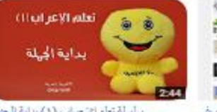
سلسلة تعلم الإعراب (1) بداية الجملة 685 views - 3 months ago