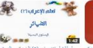
سلسلة تعلم الإعراب (2) الضمائر - المستوى البسيط 195 views - 2 months ago