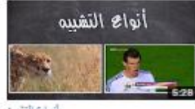
أنواع التشبيه 821 views - 3 months ago