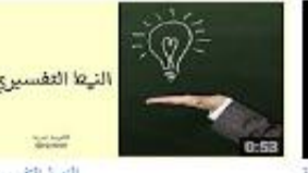
النقطة التفسيرية 348 views - 2 months ago