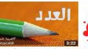
العدد والمعدود - كيف تكتب الأعداد بصورة صحيحة؟ 140 views - 3 weeks ago