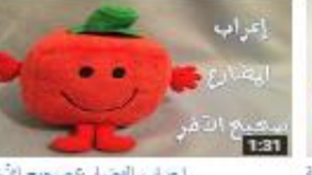
إعراب المضارع صحيح الآخر 226 views - 3 months ago