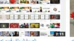
العربية السهلة - فيديو تعريفي 275 views - 3 months ago