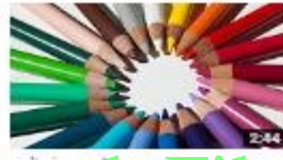
من أي حروف الجزم 276 views - 2 months ago