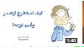
كيف تستخرج العنصر وتحدد نوعه؟ 269 views - 2 months ago