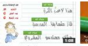
حذف النون بسبب الإضافة 123 views - 3 weeks ago