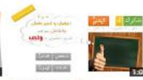
نقطة إعراب: شكرك المعلم 53 views - 2 weeks ago