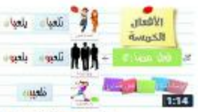
الأعمال الخمسة وكيف تربها 64 views - 1 week ago