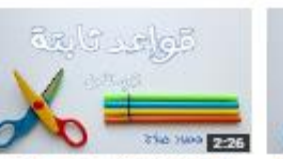
قواعد ثابتة تساعد في الإعراب الجزء الأول 125 views - 6 days ago