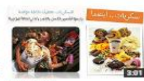
المذاكرة والطعام 46 views - 1 week ago