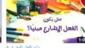
بناء الفعل المضارع 357 views - 3 months ago