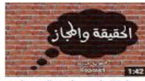
الحقيقة والجهاز 588 views - 1 month ago