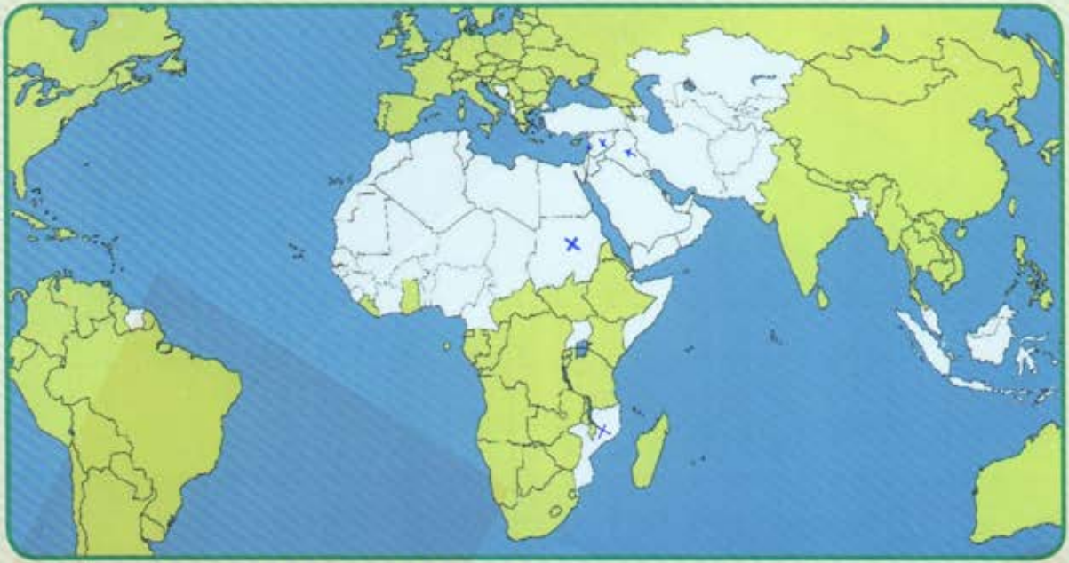
شكل (٣٠) خريطة صماء لدول العالم الإسلامي

توجد دول إسلامية تصل نسبة التصحر فيها ما بين ١٠ - ٥٠٪ ، ومنها لبنان وسوريا والسودان والعراق والسنغال غرباً حتى الصومال شرقاً . قم بتحديد مواقع هذه الدول على الخريطة التالية بالاستعانة بالـ الأطلس المدرسي .