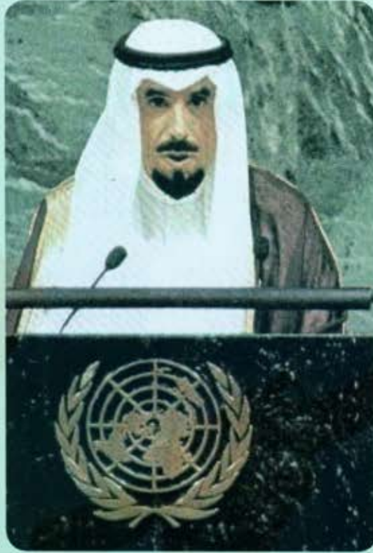
شكل رقم (٣٤) الشيخ جابر الأحمد الصباح في منصبه الأمم المتحدة وخطابه الحكيم الذي حرك العالم تجاه قضية دولة الكويت .