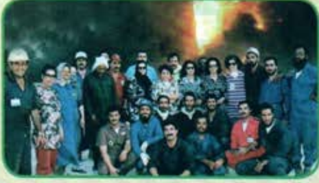
شكل رقم (٤٥) توضح فريق مكافحة الحرائق الكويتي في ٩ سبتمبر ١٩٩١م