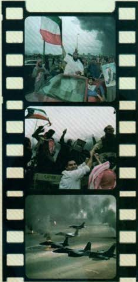
شكل رقم (٣٥) توضح الحرب الجوية و فرحة التحرير

رغم كل ما تبذله الامم المتحدة من جهود ، أن العراق يرفض الوفاء بالتزامه بتنفيذ القرار ٦٦٠ ، و القرارات اللاحقة ذات الصلة المشار اليها اعلاه مستخفا بمجلس الأمن استخفافا صارخا. واذ يضع في اعتباره واجباته و مسؤولياته المقررة بموجب ميثاق الأمم المتحدة ، تجاه صيانة السلم و الأمن الدوليين و حفظهما و تصميمها منه على تأمين الامتثال التام لقراراته . ( انسحاب القوات العراقية )