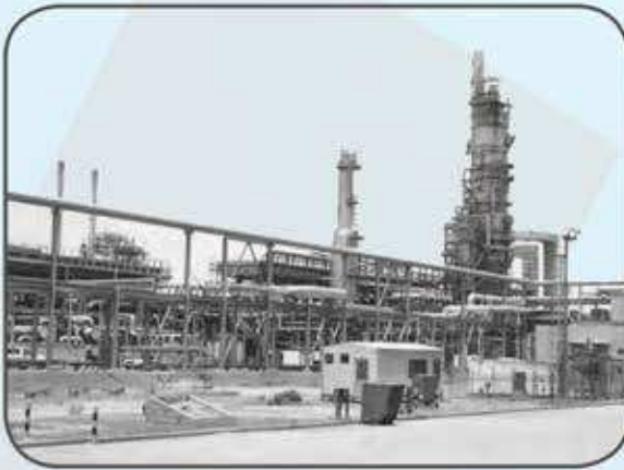
شكل (٢٩) صور توضيح عملية تكرير النفط