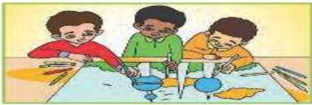
أنتم رسّامون ماهرون.