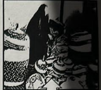
١- ..... حواري

( د ) أكمل المخططات السهمية التالية بما يناسبها :