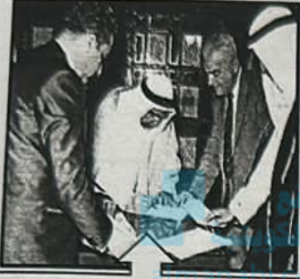
٣- ..... مجلس التعاون

( ج ) ضع عنواناً مناسباً للصور التالية :