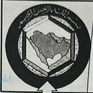
٢- ..... مجلس التعاون