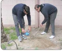
تنظيف حديقة المدرسة