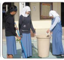
متعلمين يقومون بأعمال تطوعية تنظيف الساحة المدرسية مدرستي جميلة ونظيفة