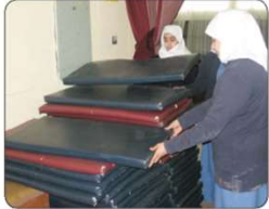
ترتيب الطاولات والكراسي ومراتب التربية البدنية