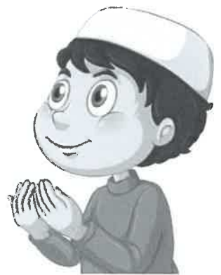
عبادة قولية ص ٨١