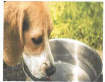
إناء ولغ فيه الكلب

الغسل سبع مرات اولاهن بالتراب / الغسل بالماء / الدلك بالتراب ص ٤٨