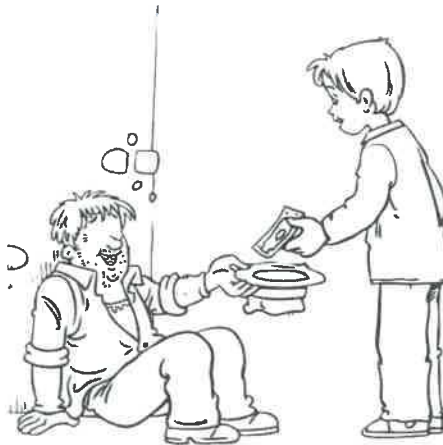
عبادة مالية ص ٨٢