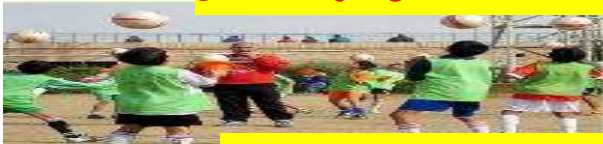
هم يلعبون بالكرة