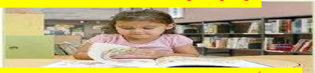
هي تقرأ القصة