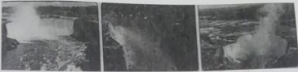
- الطباقي عند رؤية الشلالات