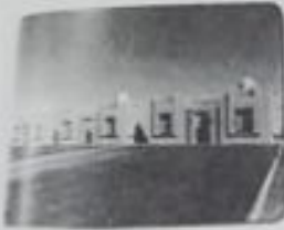
بوابت سور الكويت