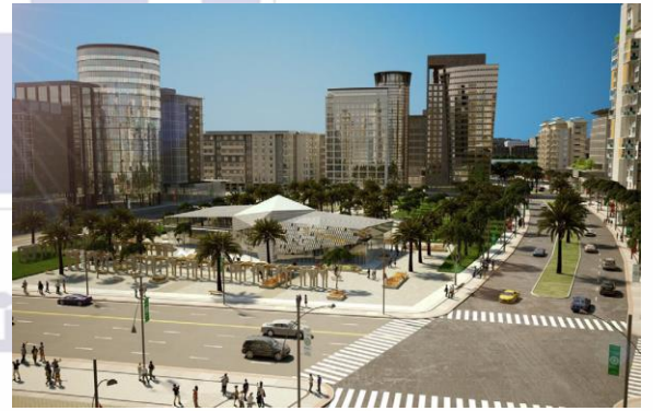
( مدينة جنوب المطلاع )