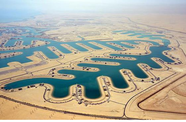
( مدينة صباح الأحمد البحرية )