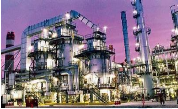
( مشروع مبادرة الوقود البيئي )