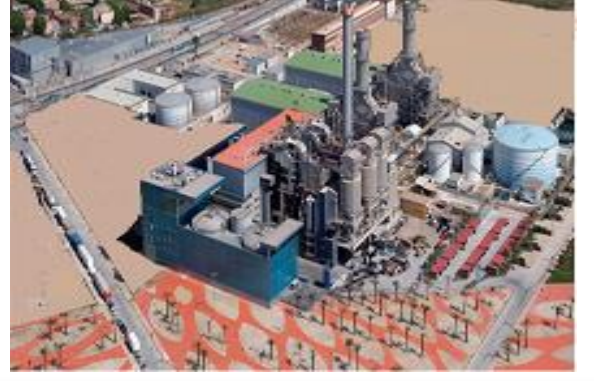
( مشروع معالجة النفايات الصلبة )