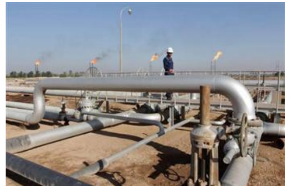
( مشروع مصفاة الزور )