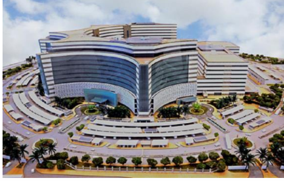
(مستشفى الشيخ جابر)