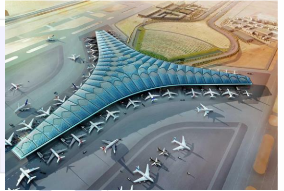
( مشروع المطار الجديد )