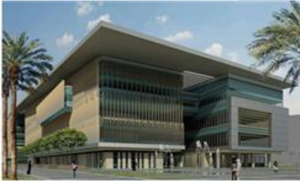
( مشروع مبنى الجامعة الجديد )