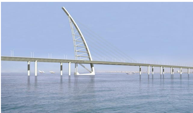
( جسر الشيخ جابر )