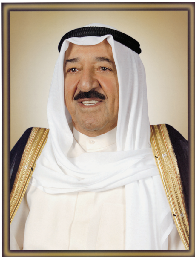
صاحب السمو الشيخ أحمد الجابر الصباح أمير دولة الكويت