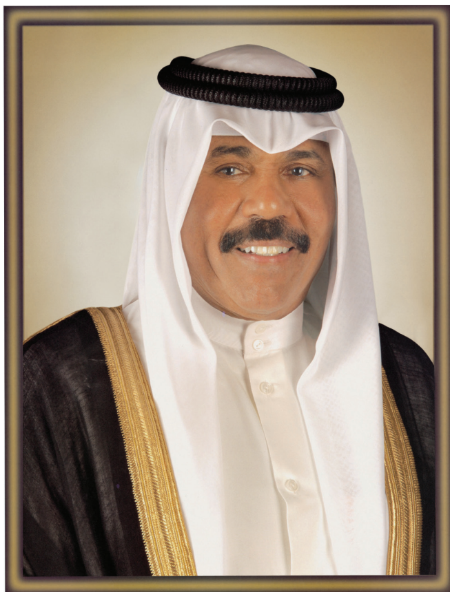
مِيْمُو الشَّيْخِ نَوَافِ بْنِ فَهْدِ بْنِ جَبْرِ الصَّبَاحِ وَلِيِّ عَهْدِ دَوْلَةِ الْكُوَيْتِ