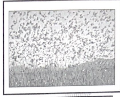
● غزو الجراد على المزارع ص ١١٩