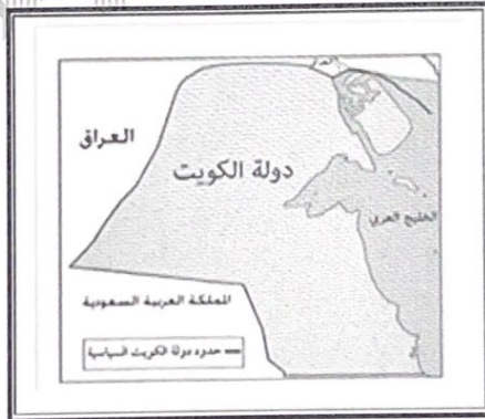
● خريطة دولة الكويت السياسية ص ١٧٦