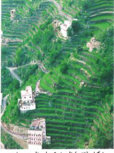
شكل (٥٣) الزراعة على المدرجات الجبلية في اليمن

ترتفع الكثافة السكانية في المناطق التي تتمتع بمقومات طبيعية ومناخية ملائمة وثروات طبيعية وطرق مواصلات ، وتنخفض الكثافة في المناطق التي لا تتوفر فيها هذه المقومات .