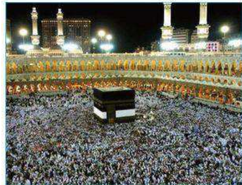
المسجد الحرام مكانه مكة المكرمة