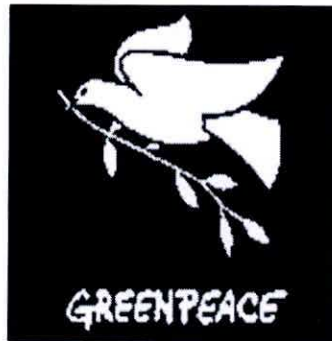
٢- حركة السلام الأخضر. ص ١٢٥