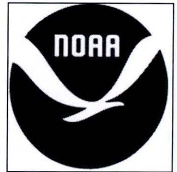
١- الإدارة البحرية و الجوية الأمريكية ص ١٢٤

وزارة التربية التوجيه الفني العام للإجتماعيات