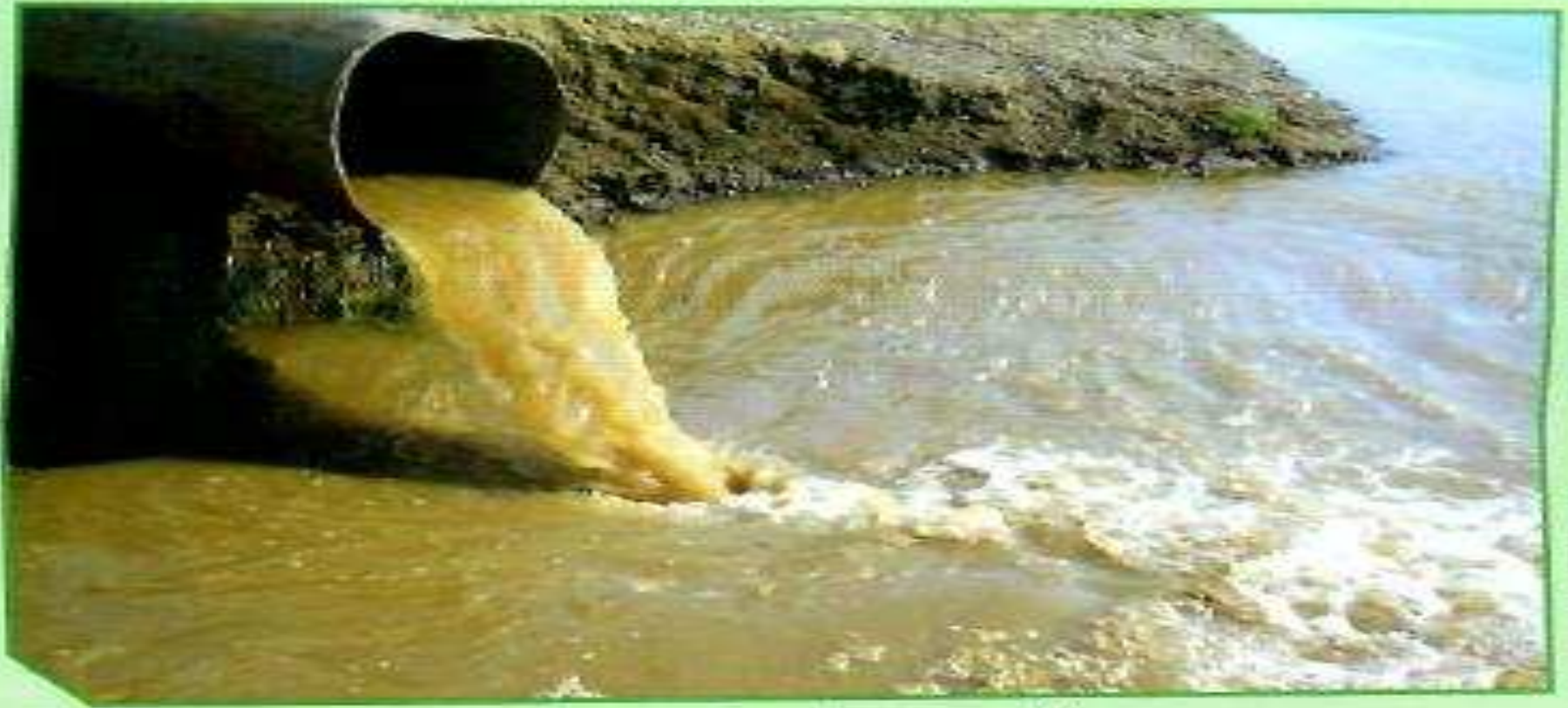
ب. تلوث مياه البحر بماء المجاري

(2) تلوث الماء يحدث عندما تتغير خصائص الماء مما يجعله غير صالح للاستخدام ، و يحدث ذلك بسبب تسرب النفط أو مياه المجاري أو المبيدات الحشرية .