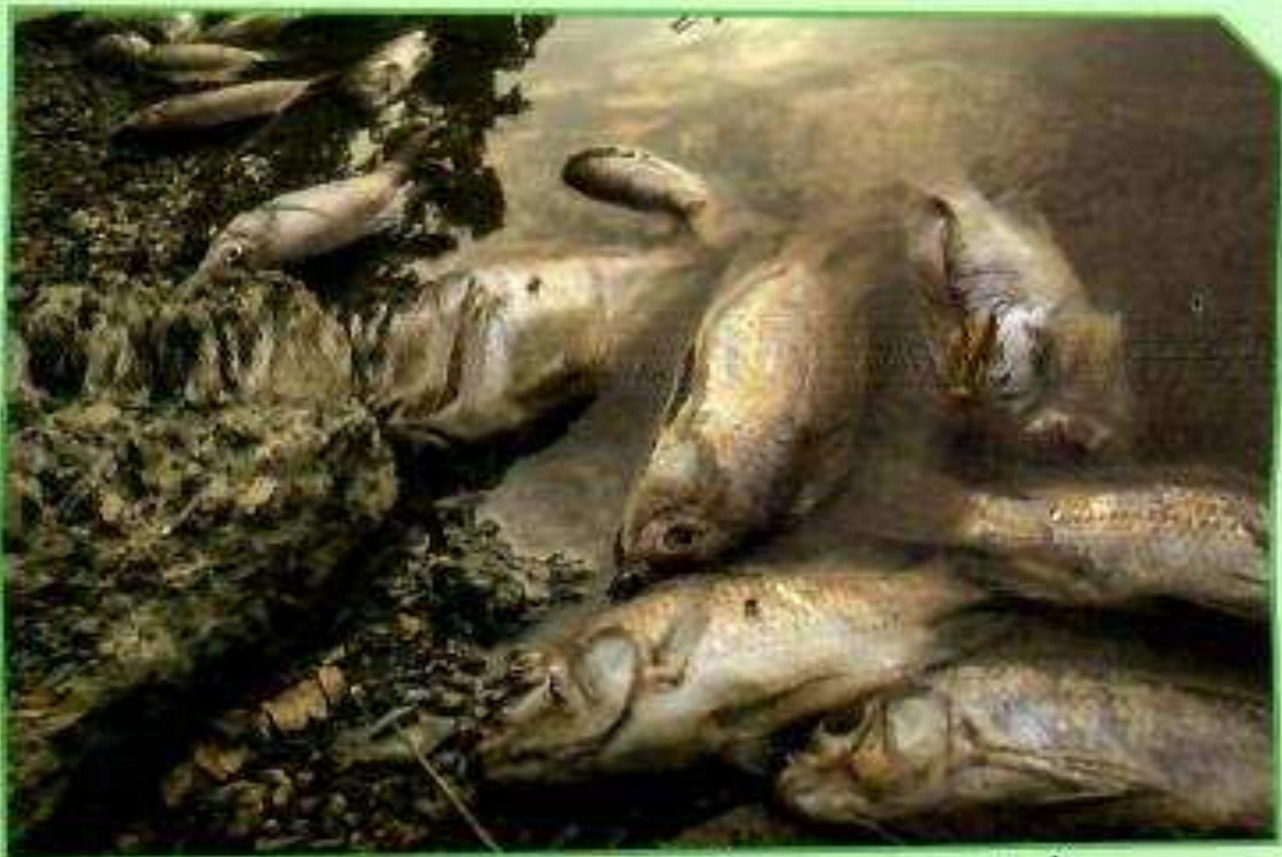
أ. ظاهرة نفوق الأسماك بسبب تلوث البحر