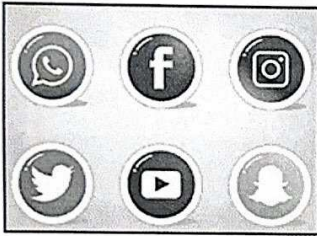
٦- وسائل التواصل الاجتماعي ص ١٢١