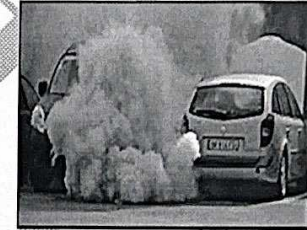
٤- التلوث الهوائي ص ١٣٣