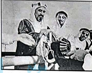
٣- تصدير أول شحنة للنفط الخام الكويتي. ص ٩٠

( أ ) ( ضع عنواناً مناسباً للصور والأشكال التالية مما درست : : (٦×١)