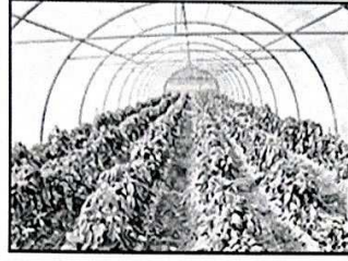
٢- الزراعة في البيوت البلاستيكية ص ٩٤