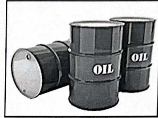
١- المادة الخام (النفط) ص ٩٨