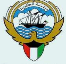
وزارة التربية MINISTRY OF EDUCATION