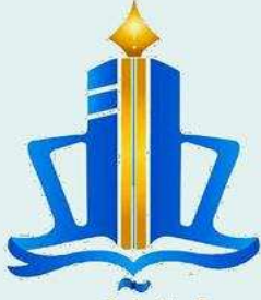
مدرسة طارق السيد رجب