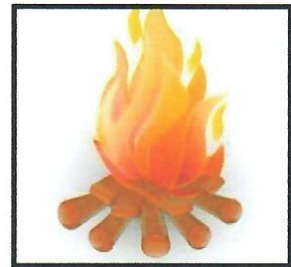
خمود نار فارس