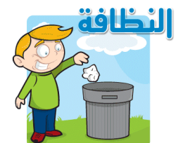
وضع النفايات في الحاوية