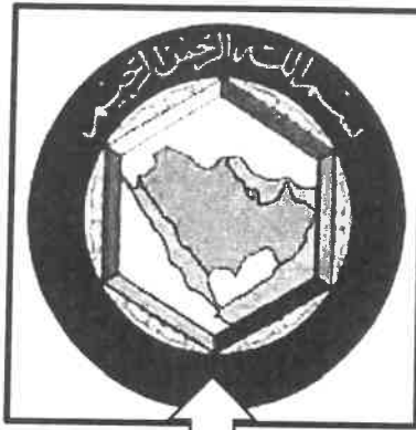
٢- شعار مجلس التعاون لدول الخليج العربية . ص ٧٧