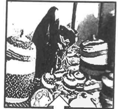
١- صناعة الخوص . ص ٢٩

( د ) أكمل المخططات السهمية التالية بما يناسبها :