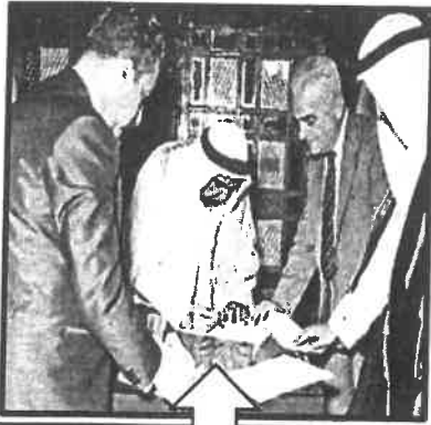
٣- الشيخ عبدالله السالم الصباح / إلغاء معاهدة الحماية . ص ٦٣

( ج ) ضع عنواناً مناسباً للصور التالية :