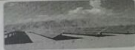
شعاع (٩٩) صورة توضح مصادر الطاقة المستخدمة الشمس والرياح

- تعد الرياح والشمس من مصادر الطاقة المتجددة .