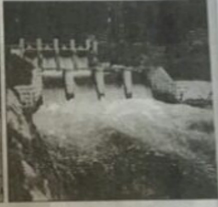
مشاريع الصندوق الكويتي في مشروع تصع مياه نبع السمر في الجمهورية العربية السورية