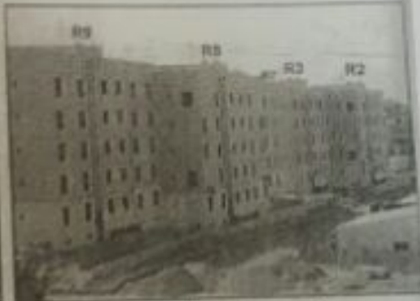
مشاريع صندوق أبو ظبي للتنمية (مدينة الشيخ زايد في قطاع غزة)