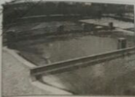
مشاريع الصندوق الكويتي في الجمهورية اليمنية (تطوير وادي ومراح)