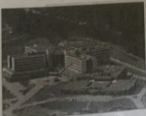
مشاريع الصندوق السعودي للتنمية توسعة مستشفى البشير في الأردن