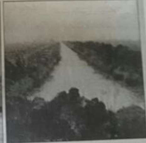
مشاريع الصندوق الكويتي في السودان صيانة وتشعيم ربي الرهد