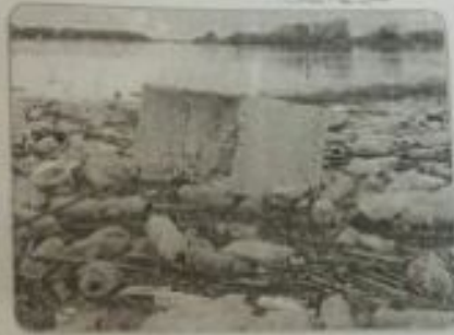
شاطئ ملوث بالنفايات