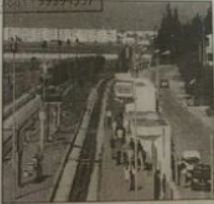
مشاريع الصندوق الكويتي في تسكك الحديدة بالمصواحي الجنوبية