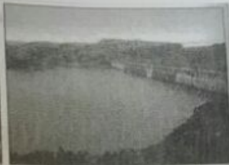
مشاريع الصندوق الكويتي في المملكة المغربية لتطوير (سد أولون)