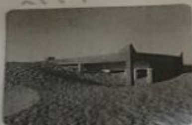
زحف الرمال على المناطق الجافة وشبه الجافة