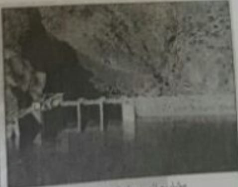
مشاريع الصندوق السعودي للتنمية (سد باندكوز في المغرب)