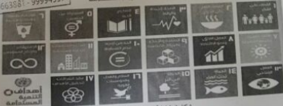
شكل ( ٩٩ ) أهداف التنمية المستدامة