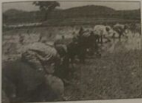
مشاريع صندوق أبو ظبي للتنمية (تطوير الزراعة في السودان)