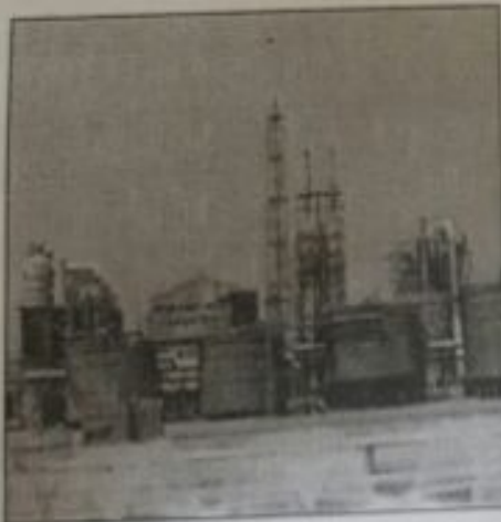
مشاريع الصندوق الكويتي في المملكة الأردنية الهاشمية مصنع الأسمدة التوسفاتية