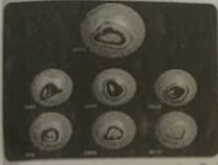
ثقب في طبقة الأوزون

- لاحظ الصور التالية ، و اكتب تعليقا مناسباً تحت كل منها :-