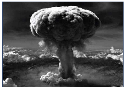
انفجار قنبلة هيروشيما - نجازاكي ) في اليابان