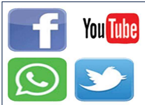
برامج التواصل الاجتماعي