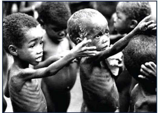
نقص في الغذاء وسوء التغذية