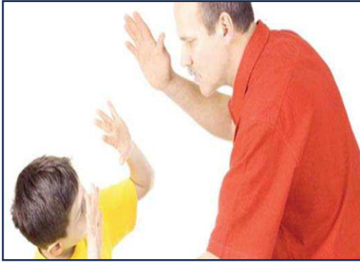
العنف ضد الأطفال