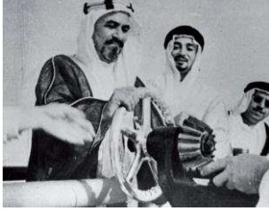
تصدير أول شحنة من النفط الكويتي

بدأ التنقيب عن النفط في دولة الكويت عام 1934م في حقل بجرة شمال الكويت ولكن الكميات التي عثر عليها كانت قليلة فاتجهت عمليات التنقيب للجنوب وترتب عليه اكتشاف كميات ضخمة في حقل البرقان.